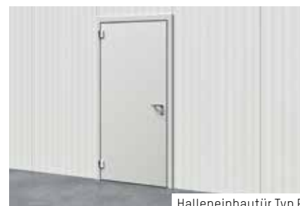
Halleneinbautür Typ P

Als Ergänzung zu den Dämmpaneelen Typ P erhalten Sie bei ROMA auf Wunsch auch die geeignete Einbautür. Da die Breite der Tür perfekt zur Breite der vertikal verlegten Paneele passt, ist die Montage unkompliziert und ohne Verschnitt. Sparen Sie sich dort, wo die Türöffnung platziert werden soll, 2,5m 2 Paneelfläche und setzen einfach die Tür dafür ein. Mehr Informationen zu dieser praktischen Lösung finden Sie in unserem Prospekt „Halleneinbautür“.