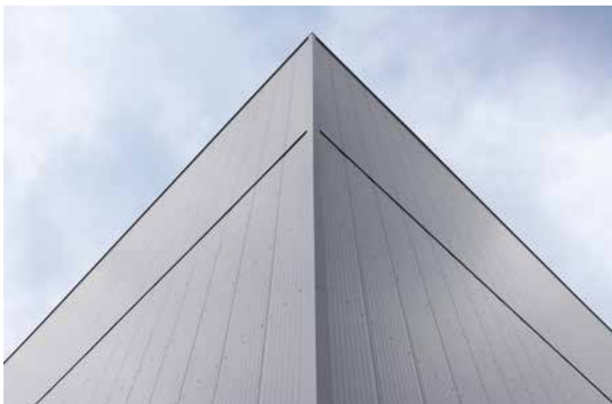
Hochregallager mit vertikaler Verlegung.

Last, but not least: Wirtschaftlichkeit und überzeugende Optik lassen sich mit ROMA bestens verbinden. Eine große Auswahl an Materialien, Oberflächen und Farbtönen ermöglicht eine hochwertige Gestaltung Ihres Bauobjekts.