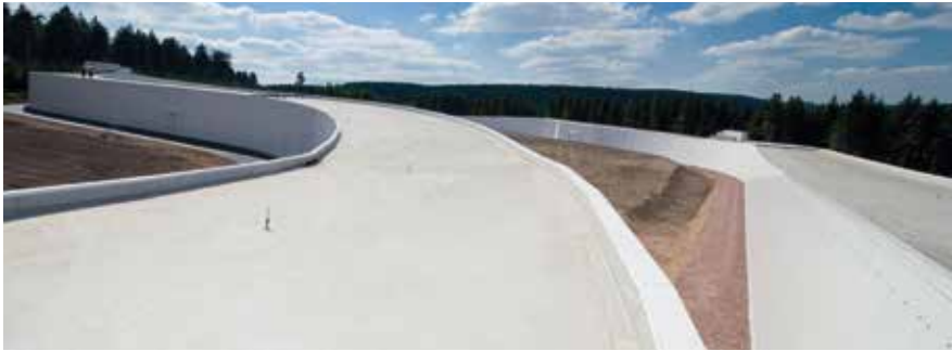
Differenzierte Gebäudeformen mit ROMA Schnellbau-Dämmpaneel (Skihalle Oberhof)