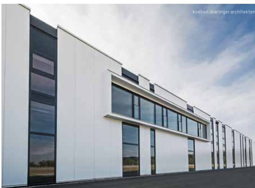
Mikroliniertes ROMA Paneel mit unsichtbarer Befestigung für ästhetisch hochwertige Fassaden.

Eine außergewöhnlich große Auswahl an Materialien, Oberflächen und Farbprogrammen ermöglicht eine hochwertige und variantenreiche Gestaltung der Baukörperflächen – kurz: anspruchsvolle Architektur im Zeichen der Wirtschaftlichkeit.