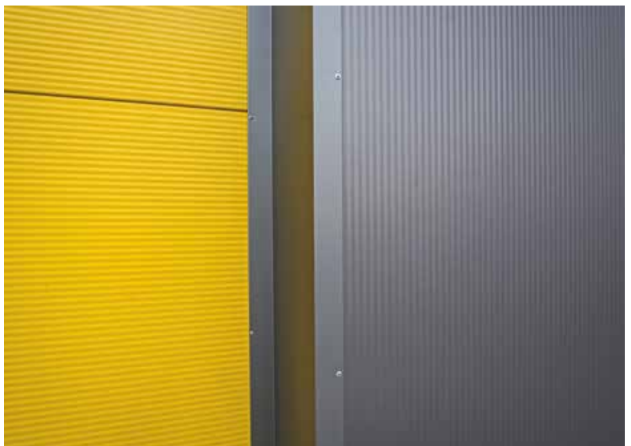
Horizontale und vertikale Verlegung