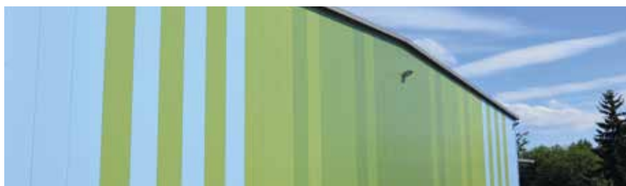
Ausgewählte Fassadenfarben passen sich den Farben der Natur an.

Eine schlanke, wirtschaftliche Bauweise darf nicht auf Kosten architektonischer Gestaltung gehen – davon sind wir überzeugt. Deshalb haben wir bei der Produktentwicklung das ROMA Schnellbau-Dämmpaneel konsequent auf die Anforderungen moderner Architektur ausgerichtet.